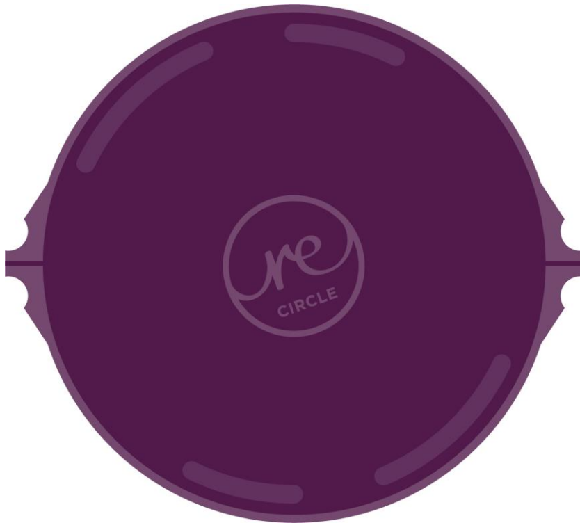
Abbildung 2: Bei reCIRCLE steht die Funktionalität der Produkte stets im Vordergrund. Sie sind einfach zu handhaben, können gründlich gereinigt werden, sind offen oder geschlossen stapelbar und sind dicht schließend.

Bei den Designs von reCIRCLE stehe die Funktionalität immer im Vordergrund. Die Verpackungen müssen einfach zu handhaben sein, gründlich zu reinigen, offen und geschlossen stapelbar und dicht schließend. Eine Pizzaverpackung habe noch zusätzliche Anforderungen, nämlich, dass die Pizza nicht nur warm, sondern auch knusprig bleibe. «Darüber wurde heftig mit den Experten aus der Branche und den involvierten Endkund:innen diskutiert. Wir fanden heraus, dass für viele Pizzaiolos die Pizza knusprig sein muss, sehr viele Endkonsumenten jedoch lieber eine heiße Pizza möchten. Darum haben wir kurzerhand eine flexible Belüftung designt», fasst Thorben Bechtoldt zusammen. Der Fakt, dass man die BOX ganz schließen könne, helfe auch für den Rücktransport der leeren BOX.